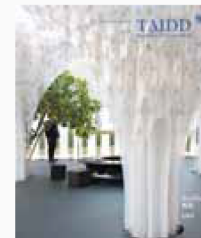
封面圖片 NotaNumber Architects 作品 Bulgari Pavilion