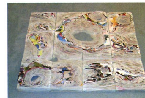
2/ «пролет-лято 2005» «printemps-été 2005» хартия и макетен нож, 12 каталога, 4смх104см, 2005 Вариации формати, дебелини и цветове papier et cutter, 12 catalogues, 84cmx104cm, 2005 Variabilité des formats, épaisseurs et couleurs