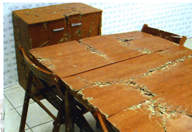
1/ Артикул Codes articles Мебели от талашит, 2004 Meubles en aggloméré, 2004