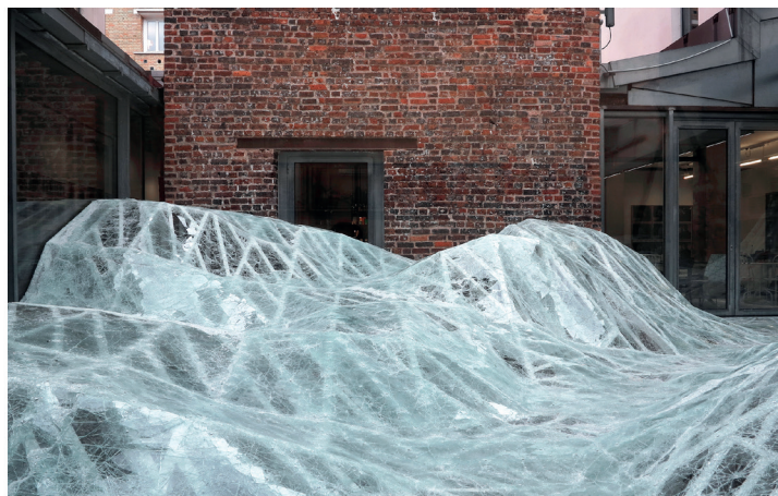
Baptiste Debombourg, Acceleration Field , 2015

Una distesa informe di 250 metri quadrati di vetro ha colonizzato gli spazi esterni della Maison Rouge di Parigi. La monumentale installazione site-specific è di Baptiste Debombourg , ed è il secondo capitolo di una trilogia che l'artista francese ha dedicato al vetro, materiale a cui è interessato dal 2005.